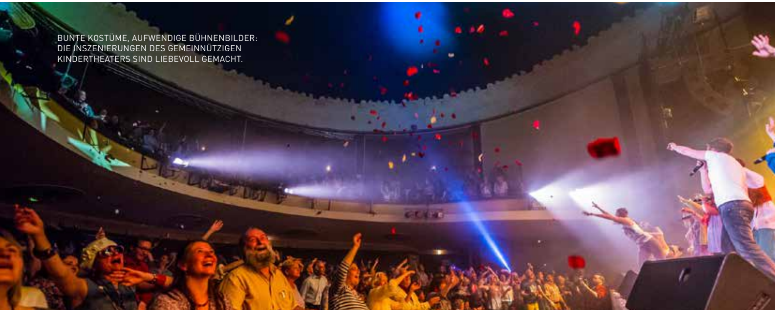
BUNTE KOSTÜME, AUFWENDIGE BÜHNENBILDER: DIE INSZENIERUNGEN DES GEMEINNÜTZIGEN KINDERTHEATERS SIND LIEBEVOLL GEMACHT.