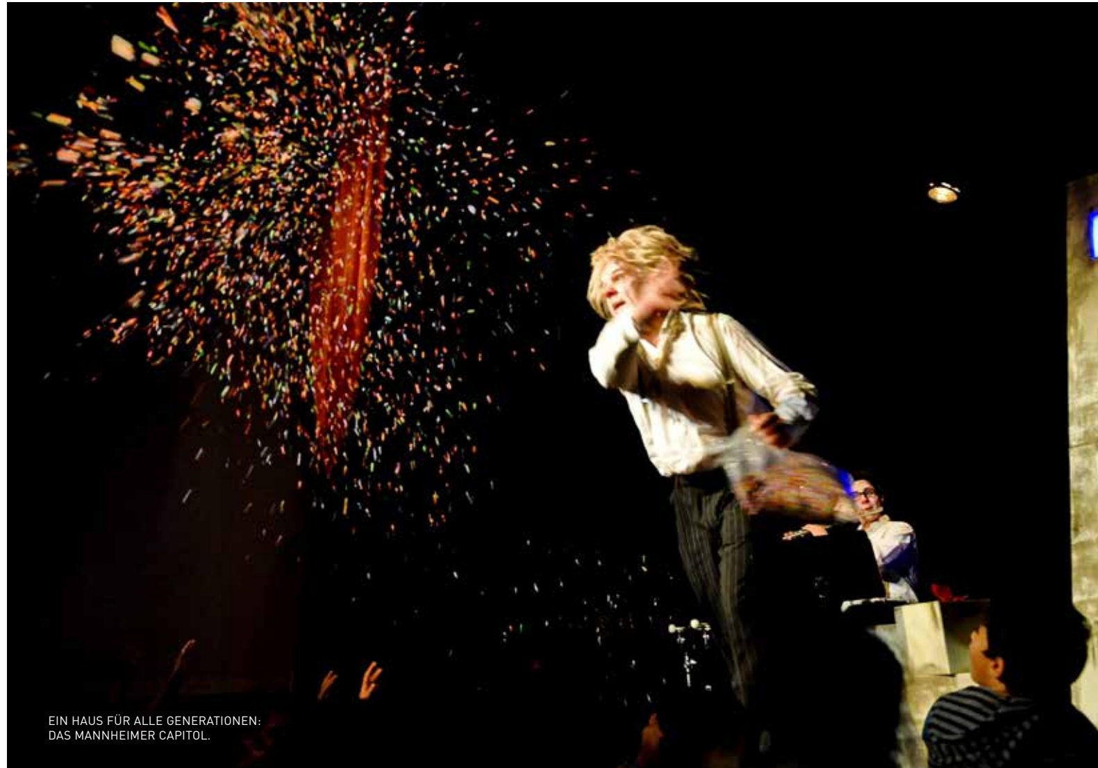
EIN HAUS FÜR ALLE GENERATIONEN: DAS MANNHEIMER CAPITOL.